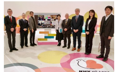
写真は12/19表彰式の模様